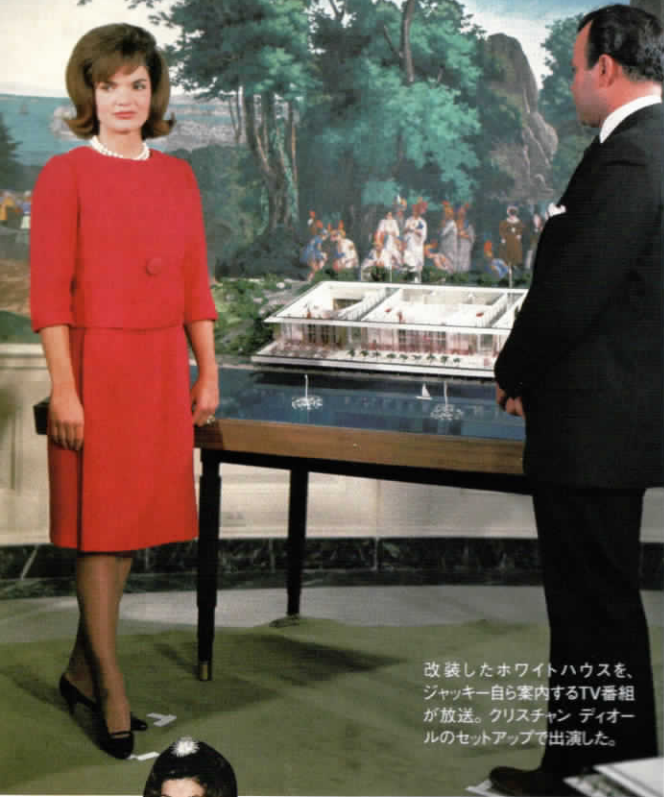
改装したホワイトハウスを、ジャッキー自ら案内するTV番組が放送。クリスチャン ディオール のセットアップで出演した。