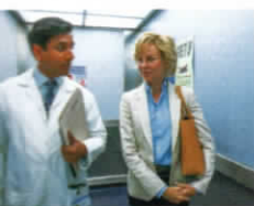
人の夫を見舞いに行った病院で、 翼外科医のハスナット・カーンと出 会い、恋に落ちる。ハスナットはダイ アナをセレブ扱いしない男だった。