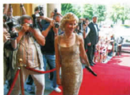
1995年、チャールズ皇太子と別居 して3年。華やかなスポットライトを浴 びる日々は続いたが、ケンジントン宮 殿で一人で暮らす日々は孤独だった。