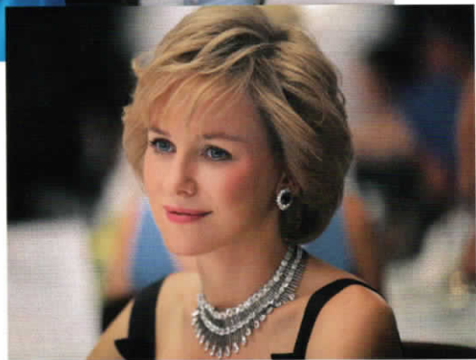
3 36歳の誕生日パー ティには、お気に入りの デザイナーのジャック・ アザグリーに贈られたロ ングドレスで。首もとに 輝くゴージャスなジュエ リーはショパール。