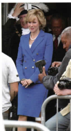
DRESS: JACQUES AZAGURY