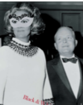
Black & White Ball