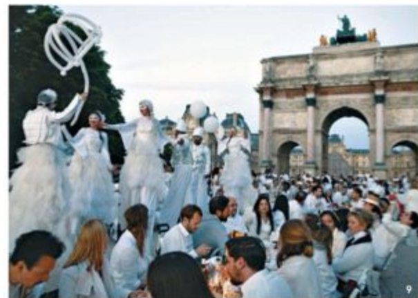
9 世界の30以上の都市に広まったホワイトディナー。2019年6月、パリのルーブル美術館の前で開催。10 ホワイトディナー30周年の2018年、パリのアンヴァリッドにて。一面、白の美しい人々が埋め尽くされて、11、12 エンjoyする気持ちにあふれた、ウィットを感じるファッション。