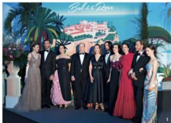
1 アルベール2世公、カロリーヌ公女、アンドレア・カシラギ夫妻、ピエール・カシラギ夫妻、シャルロット・カシラギ夫妻、グレース公妃の直系が勢揃い。2、3 2019年のテーマは「リビエラ」。4 カロリーヌ公女と親交が深く、1999年からアート・ディレクターを務めたカール・ラガーフェルドへの追悼も。

「パーティー」 現代ではパーティも多様に進化し、社会にメッセージを発信するなど大きな存在感をもつように。特に社会を動かすパワーのある注目のパーティを、中野さんに紹介していただきます。