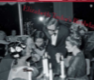
Elizabeth Taylor's Birthday Party