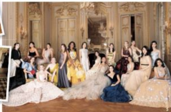
5 世界から選ばれた19人の令嬢がデビュー。チャリティも大きな目的で、東南アジア諸国の少女の教育や、女性のメンタルに関する団体をサポート。6 2018年はシャンブリラ ホテル パリで開催。7 エスコート役のキャリエたちも皆、名家の子息。8 宴のハイライト、ワルツを踊る令嬢たち。The Partner of le Bal: Hotel: Shangri-La Hotel Paris Jeweller: HARAKH Car: The Renault Group Make-up artists: By Terry Hairdresser: Alexandre de Paris Association: Seleni et Enfants d'Asie