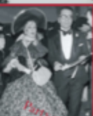
Party at the La Follies