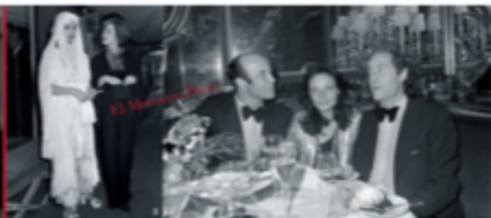
El Mamma Party