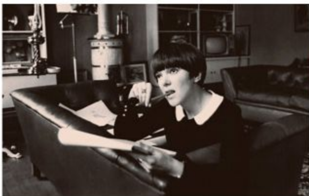
自宅でドレス・デザイン を考えるマリー・クワント。1968年撮影。

アティテュード（態度、考え方）、ひいては行動、そして社会そのものだった。ファッション史の流れも変えた。上流階級からストリートへ「降りて」くる流行の向きを変え、ストリート発のファッションを上流階級に模倣させた。