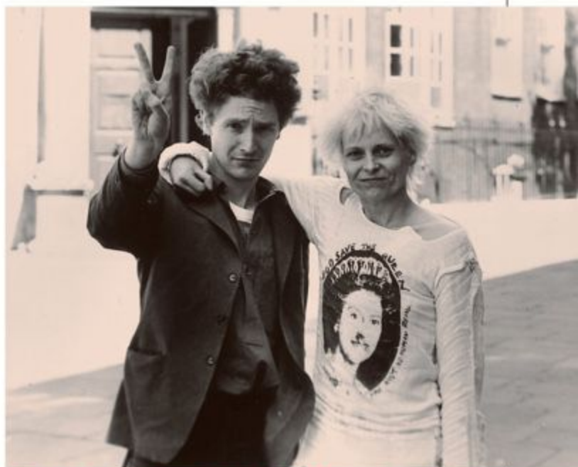
ヴィヴィアン・ウエストウッドと当時の夫マルコム・マクラレン。ヴィヴィアンが着ているのは夫がプロデュースしたバンド、セックス・ピストルズのTシャツ。

Profile 中野香織(なかの・かおり):服飾史家として研究、執筆、講演を行うほか、昭和女子大学客員教授、企業のアドバイザーを務める。日本経済新聞・読売新聞ほか多数媒体で連載中。著書『イノベーター』で読むアパレル全史(日本実業出版社)、『ロイヤルスタイル 英国王室ファッション史』(吉川弘文館)ほか多数。