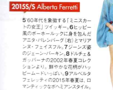
2015S/S Alberta Ferretti

5 60年代を象徴する「ミニスカートの女王」ツイッギー。6 ヒッピー風のボーホルックに身を包んだアニタ・バレンバーグ(右)とリアンヌ・フェイスフル。7 ジーンズ姿のジェーン・パーキン。8 ドルチェ&ガッパナの2002年春夏コレクションより。鮮やかな花柄がハッピームードいっぱい。9 アルベルタフェレティの2015年春夏は、ロマンティックなボヘミアンスタイル。