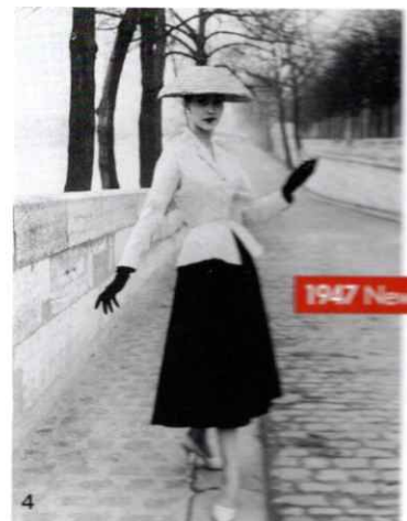
1947 New Look

1'20年代が舞台の映画「華麗なるギャツビー」(1974年)より。ヒロインを演じたミア・ファロの華やかな装いに注目。2戦時下の「ハーバース・バザー」(1943年3月号)。モデルはローレン・バコール。3美週刊誌「ピクチャー・ポスト」(1946年8月号3日号)の表紙を飾ったビキニ姿のモデル。4クリスチャン・ディオールが発表した「コロル」ラインが新時代のファッションに。