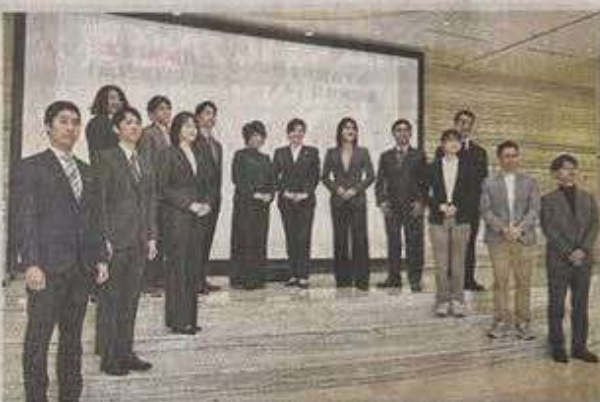
高知信用金庫が新たにまとめた 服装規定「正統派ビジネスカジュアル」の発表会 (高知市春野町弘岡下)

職場での軽装を認める動きが広がる中、高知信用金庫は来年1月から「正統派ビジネスカジュアル」と銘打った服装規定を運用する。「金融機関としての信頼感と、顧客の親しみやすさを両立するファッション」を、曜日や業務に応じて3